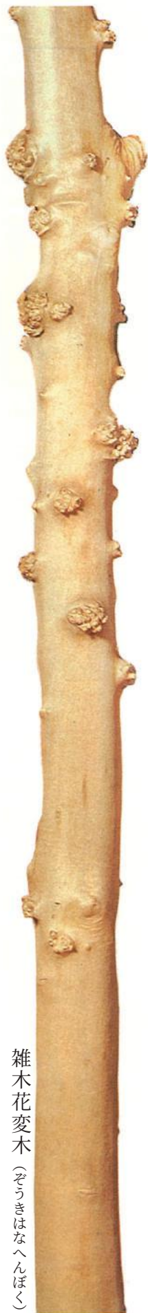
雑木花変木 (ぞうきはなへんぼく)