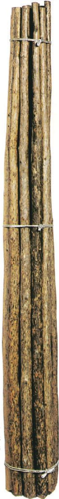
吉野鏝 (よしのさび)