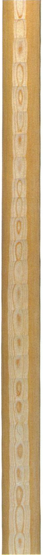
杉面皮柱 (すぎめんかわはしら)