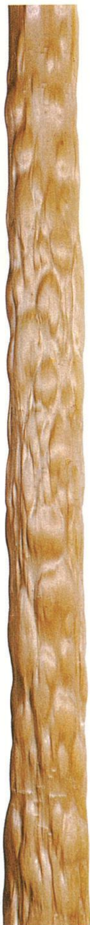
天然出絞丸太 (てんねんでしぼりまるた)