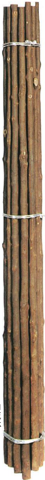
山花林 (やまかりん)