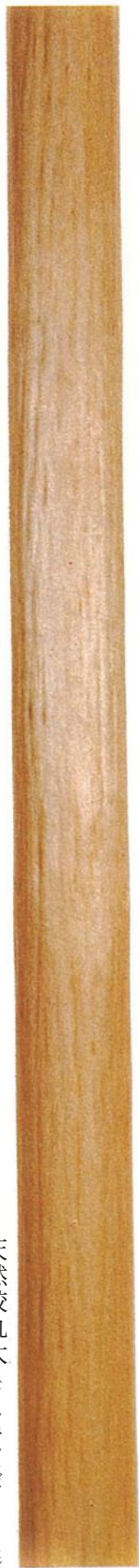
天然絞丸太 (てんねんしぼりまるた)