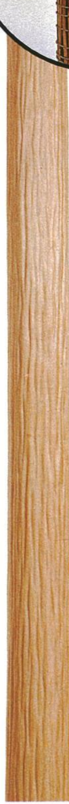
人造絞丸太 (じんぞうしぼりまるた)