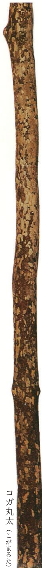
コガ丸太 (こがまるた)