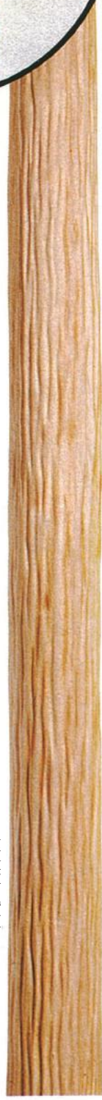
人造絞丸太 (じんぞうしぼりまるた)