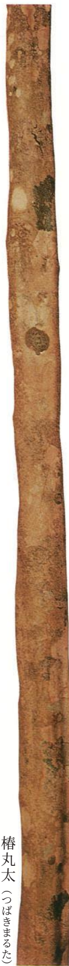
椿丸太 (つばきまるた)