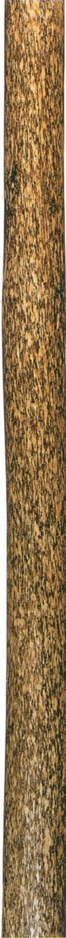
檜錆丸太 (ひのきさびまるた)