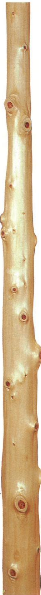
檜出節丸太 (ひのきでぶしまるた)