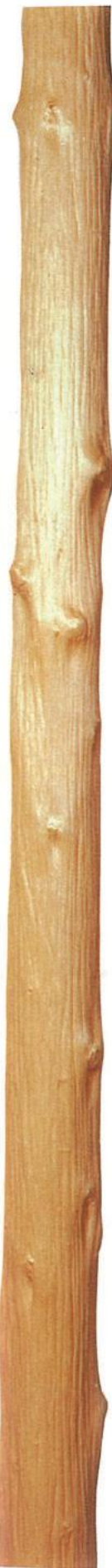
椎丸太 (しいまるた)