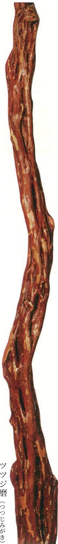
ツツジ磨 (つつじみがき)