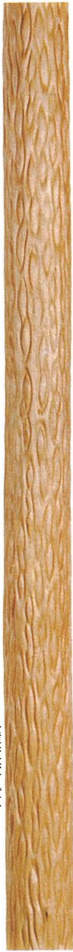
人造変絞丸太 (じんぞうへんしぼりまるた)