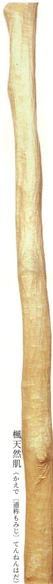
楓天然肌 (かえで [通称もみじ] てんねんはだ)