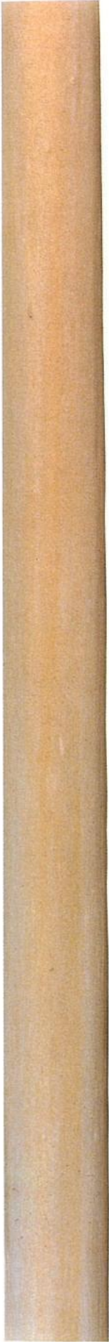
北山磨丸太 (きたやまみがきまるた)