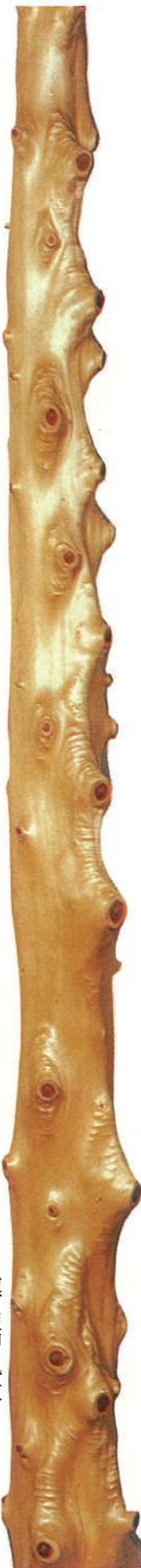
槇出節丸太 (まきでぶしまるた)